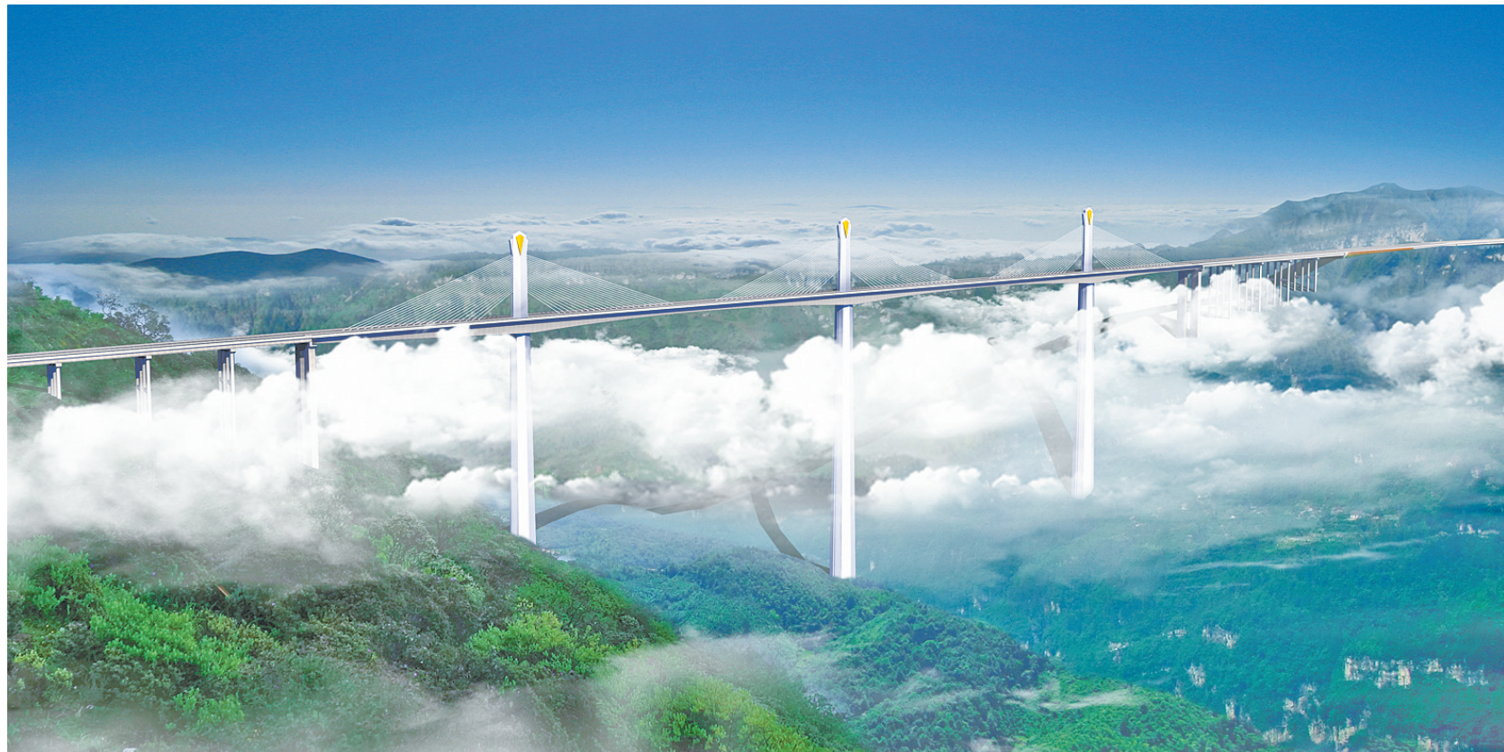
乐西高速马边特大桥。