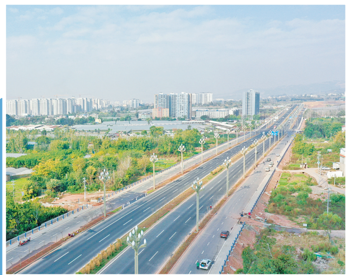
西昌市绕城公路一期工程(北环线)建成通车。

研究西昌至香格里拉、雅安经西昌至昆明、西昌经昭通至粤港澳大湾区、雅安经昭通至越南等方向客货运专线,并积极争取纳