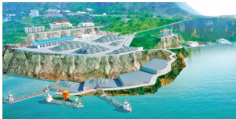
金沙口作业区规划效果图。

第三步,到本世纪中叶,全面建成四川南向门户区域性综合交通枢纽,交通发展综合水平基本达到国内较发达地区水平,凉山成为四川南向开放,面向南亚、东南亚地区的交通门户枢纽。