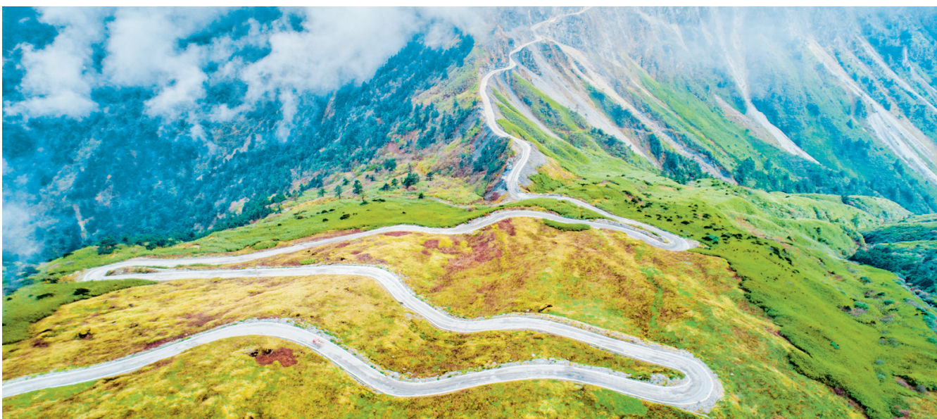
金阳县高峰乡旅游产业路。